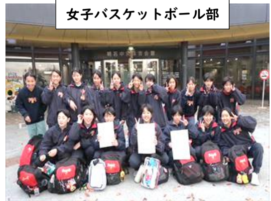
女子バスケットボール部