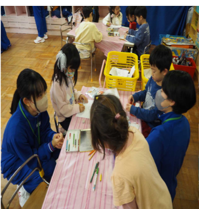
(写真左)描いた絵をお姉さんにみってもらってる園児