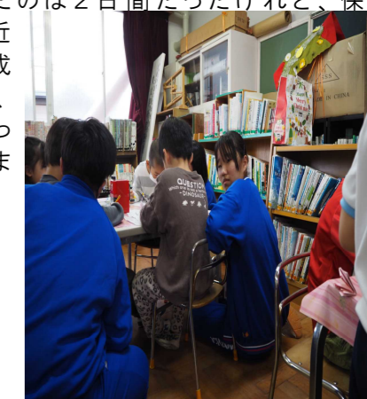
(写真上)園児たちとお絵描きをしている様子

これからもこのような機会があれば、積極的に参加して、少しでも、保育士になるという夢に近づきたいです。