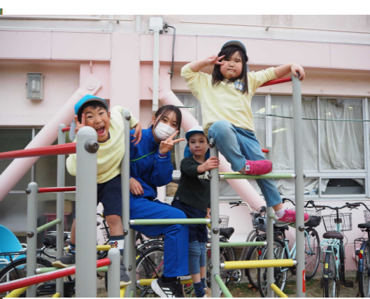
(左)塚口幼稚園の園児たちと塗り絵をしている様子。(中)ジャングルジムでお姉さんと(右)雲梯で元気に遊ぶ園児たち