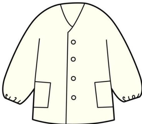
白地前開き・長そで ボタンの数は問わない