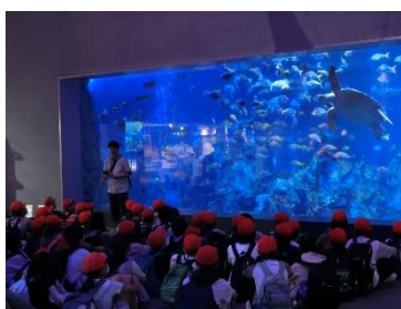
鳥羽水族館 大水槽