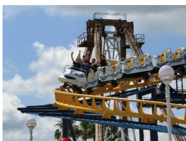
パルケエスパニーヤ キティモンセラー

さて、6月13日（木）、14日（金）に6年生が修学旅行に行ってきました。1日目は三重県志摩市にある「志摩スペイン村」、2日目は三重県鳥羽市にある「鳥羽水族館」です。1日目のスペイン村では、日中はパルケエスパニーヤで友だちとたくさんあるアトラクションに乗ったり、お土産を買ったりと仲良く過ごしました。夜はホテルでビュッフェ形式の夕食を食べ、その後、鳥羽水族館の方に来ていただいて、生き物セミナーをしていただきました。セミナーでは、鳥羽水族館のことや水族館の仕事、生き物について教えていただきました。2日目の鳥羽水族館では、ジュゴンやラッコをはじめ、たくさんの生き物を見たり、アシカやセイウチのショーを見たりと、日本一の飼育数を誇る鳥羽水族館を満喫していました。2日ともグループ活動でしたが、子どもたちは友だちのことを気遣いながら上手に過ごすことができていました。6年生の優しさがよくわかる2日間でした。