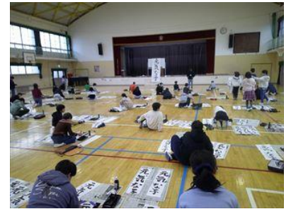
4年生 書き初めの様子

2月に入りました。まだまだ寒さも厳しいですが、立春も間近となり、季節も少しずつ春に向かっていきます。いよいよ、今年度もあと、2か月となりました。それぞれの学年で最後の締めくくりに向けて、学習に取り組んでいます。この2か月を有意義に過ごせるよう、教職員一同子どもたちに寄り添いながら取り組んでまいります。