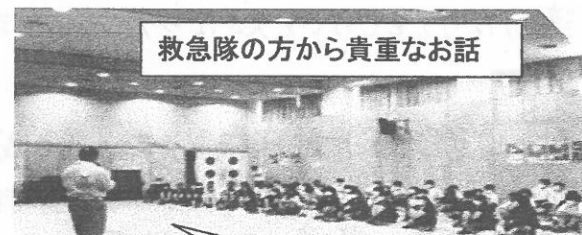
救急隊の方から貴重なお話

7月14・15日の2日間、尼崎市北消防署 園田分署の隊員のご指導のもと、心肺蘇生法やAEDの使用方法を学びました。