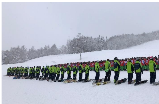
スキー学校開講式