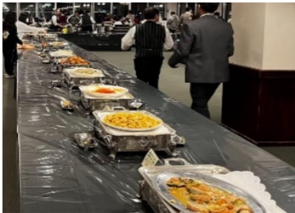
おなか一杯食べましたね