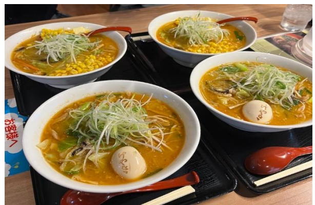
新千歳空港で昼食