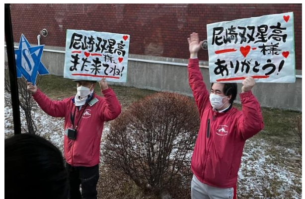
皆様、ありがとうございました