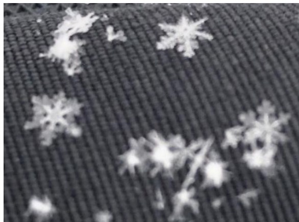
雪の1粒1粒が結晶でした