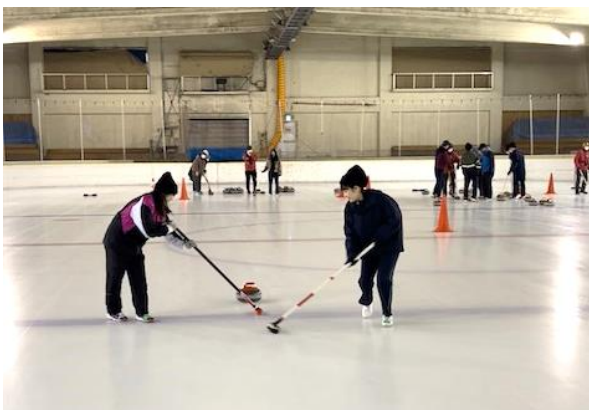
初日にカーリング体験のクラスも