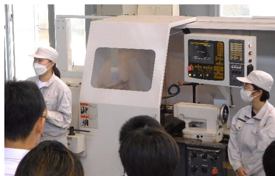
実習工場での説明、実演