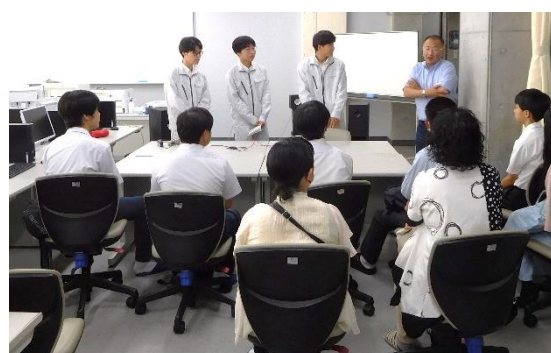
実習棟や実習教室での説明、実演