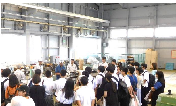
ものづくり機械科