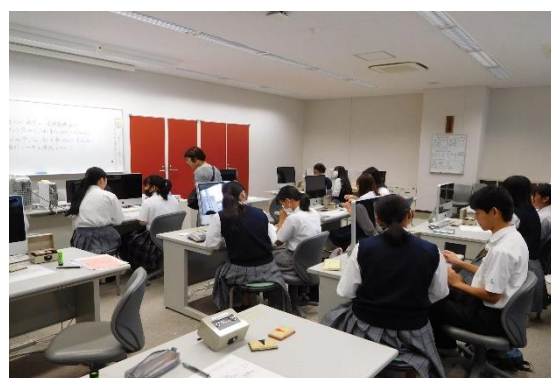
実習フロア、実習教室での実習体験